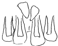
パノラマエックス線写真

【麻酔法】：全身麻酔 麻酔時間：1時間30分 手術時間：1時間2分 出血量：少量